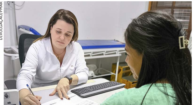
ATENDIMENTOS foram nos postos Saúde da Família

O Dia D de Cuidados para mulheres, promovido pela Prefeitura de Angra no sábado, 15, garantiu acesso a serviços de saúde e bem-estar a mais de mil mulheres em 18 unidades de saúde do município. A iniciativa fez parte da programação do Mês da Mulher Angra 2025.