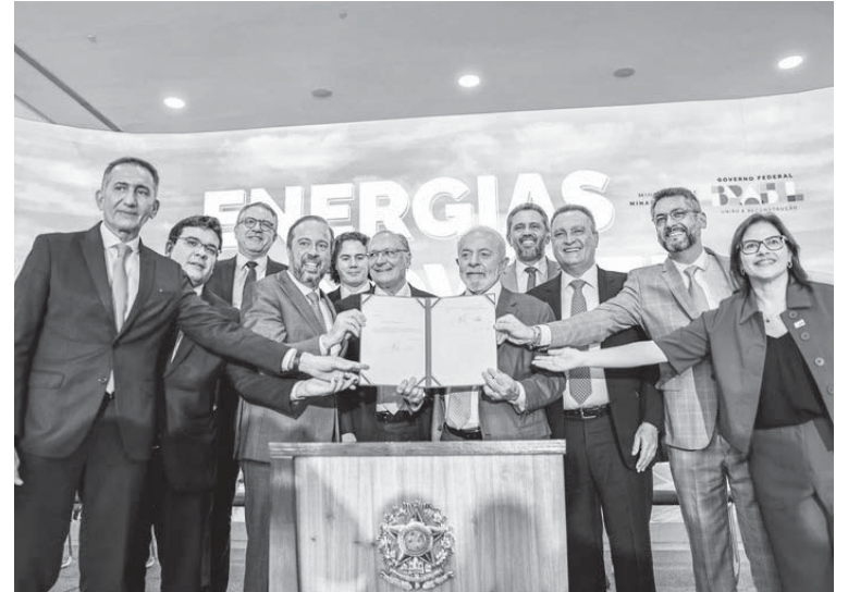
POLÍTICOS e empresários comemoraram a nova MP