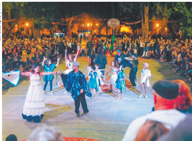
PROVAS da Mega Gincana ocorrem no Centro Histórico

tários, professores e jornalistas, estará presente para avaliar critérios como a performance e os figurinos.