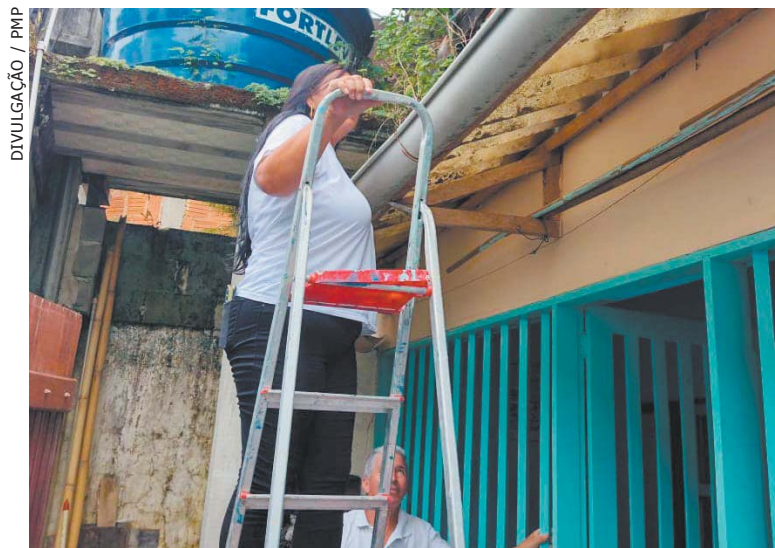
AÇÃO de prevenção a dengue em bairros será mantida

— Este é um ponto de atenção para redobramos os cui-