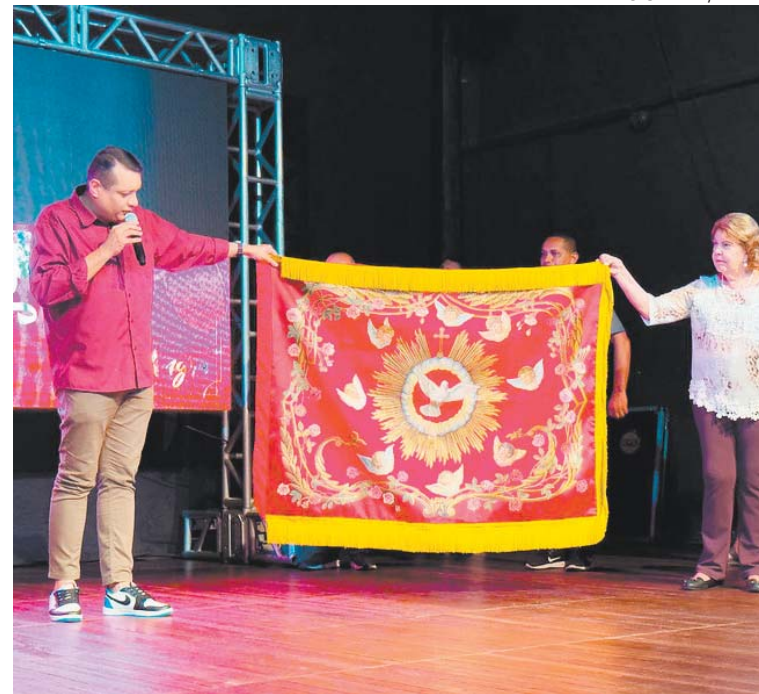
BANDEIRA da Festa do Divino foi elaborada por artista