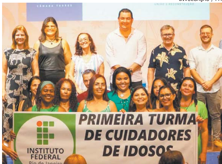
NOVOS cuidadores de idosos formados já em Paraty

A partir do segundo semestre, a prefeitura crê que os cur-