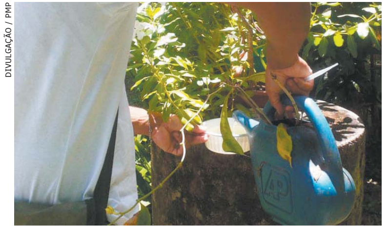
VASOS de plantas são criadouros comuns de mosquitos

Em Angra, a prefeitura decidiu decretar situação de emergência de saúde pública para fortalecer a capacidade de resposta do município no