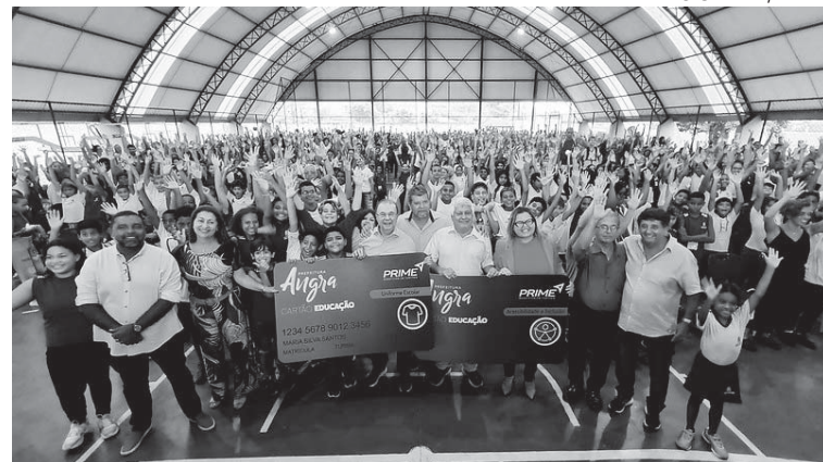
LUIS LARA / PMAR

Iniciativa prioneira da prefeitura de Angra, o Cartão Educação está contemplando alunos da educação infantil,