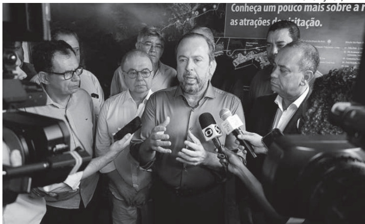
MINISTRO (C) defendeu a conclusão da nova usina

de Minas e Energia, juntamente com os prefeitos de Paraty e Rio Claro. Foi uma conversa muito produtiva, e agora vamos aguardar, pois a obra de Angra 3 só trará benefícios para o país. A obra é importante, mas para isso precisamos que a Eletronuclear cumpra o compromisso junto aos municípios