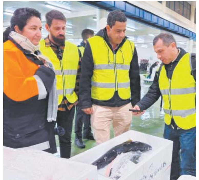
PORTO DE VIGO é um dos maiores da Europa

A agenda de Paraty na Europa teve reuniões importantes sobre desenvolvimento econômico e ambiental, energias renováveis, capacitação profissional e tecnologias inovadoras e foi concluída com a expectativa de se fomentar, em nível local, políticas públicas para o crescimento das áreas de pesca e ambiente no município de Paraty. ■