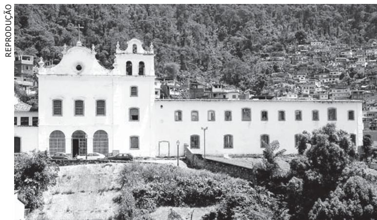
REPRODUÇÃO REFORMA do convento São Bernardino foi incluída

Obras de contenção de encostas também estão entre as prioridades apresentadas por Angra, entre elas em Monsuaba, no Campo Belo e nos morros do Santo Antônio e Carioca. Foi solicitado recurso tam-