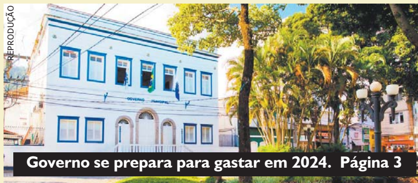
Governo se prepara para gastar em 2024. Página 3