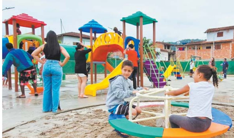
A NOVA área de lazer na Mangueira já está funcionando